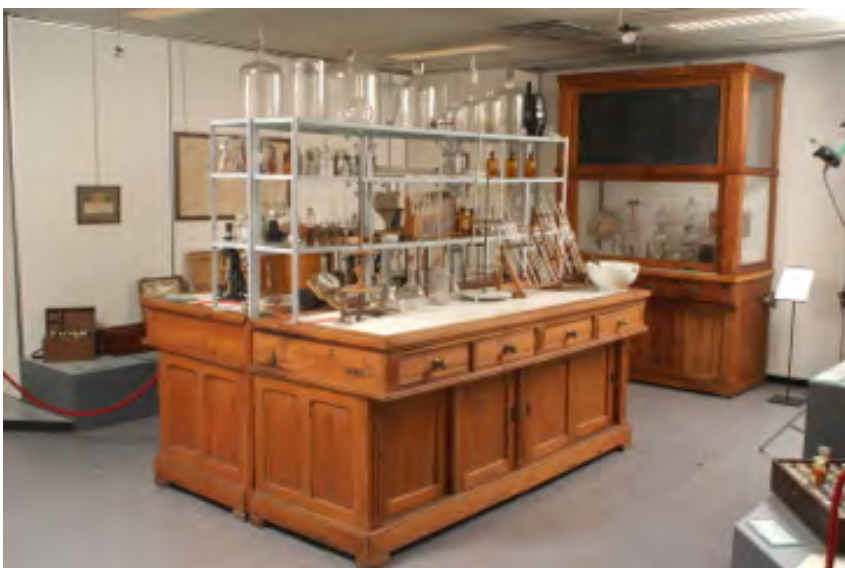
Ricostruzione di un Laboratorio di chimica. Bancone da laboratorio con strumenti per l'analisi chimica