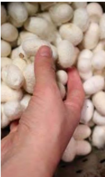
Bozzoli del baco da seta. All'interno del Museo è stato predisposto un percorso tattile per visitatori non vedenti anche se tutti i visitatori possono usufruirne

Quindi, se noi torniamo alla porta d'ingresso e da qui iniziamo il nostro percorso per partire dal topo e arrivare al macellaio, la prima sala che