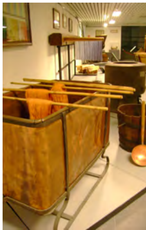
Sala della tintoria. Le matasse di seta venivano purgate e tinte in pirole di rame