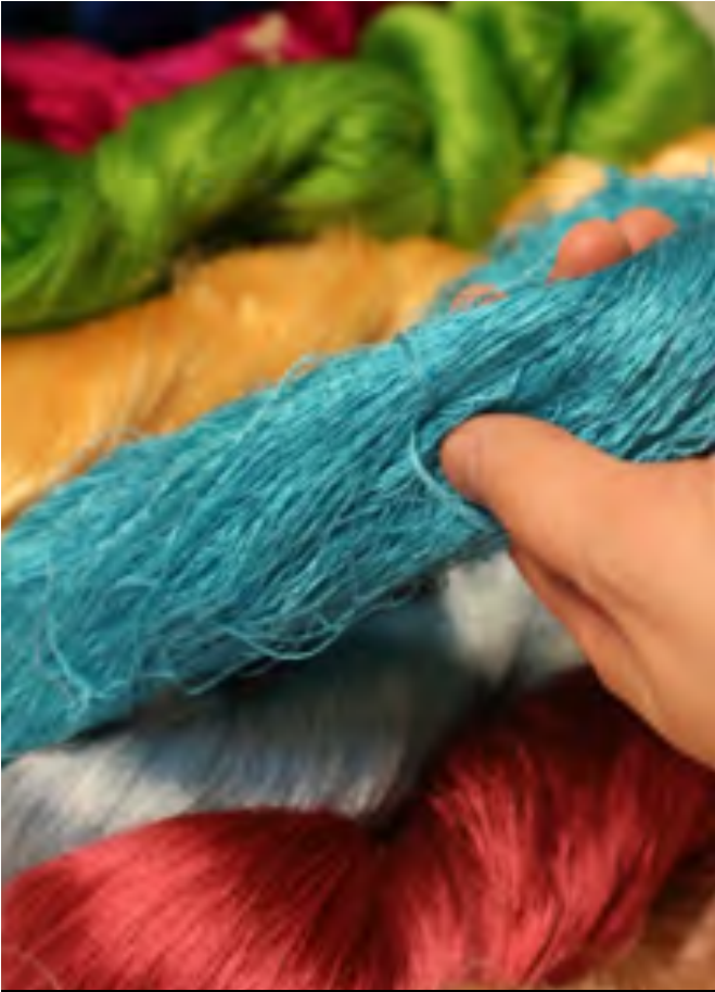
Matasse di seta tinte in vari colori