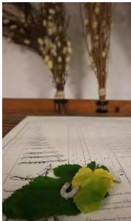
Un baco da seta su foglie di gelso. Sullo sfondo il famoso "bosco", su cui i bachi da seta si arrampicano per costruire il proprio bozzolo