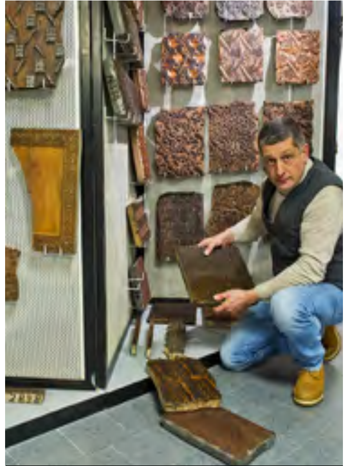
Sala della stampa a mano. Collezione di planche da stampa