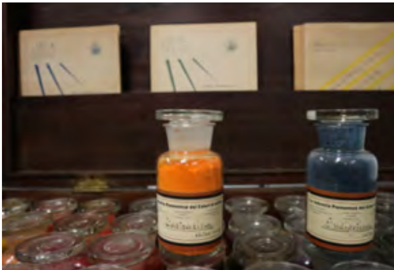
Collezione di coloranti all'anilina usati negli anni intorno al 1940