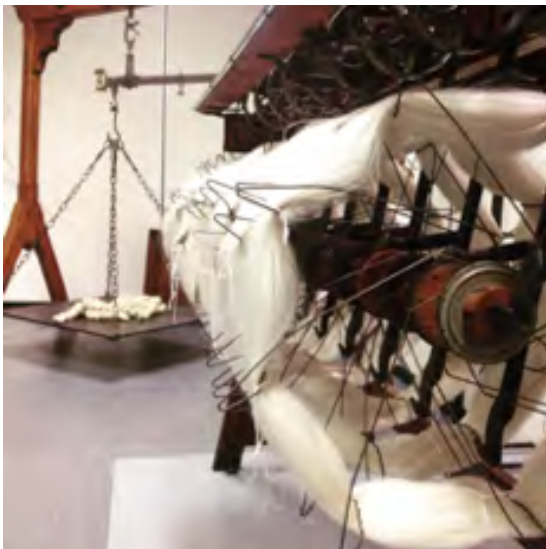
Aspo e bilancia