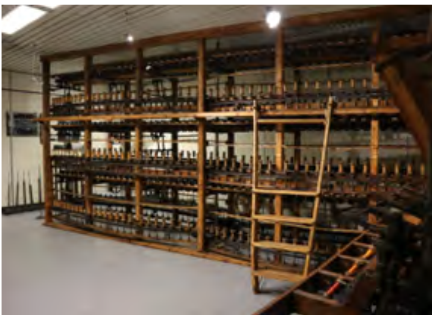
Sala della torcitura. Torcitoio "piantello a pancia in fuori" mosso ad energia idraulica