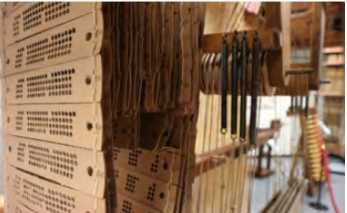
Cartoni forati. Dettaglio di un telaio a mano con sistema jacquard del 1890