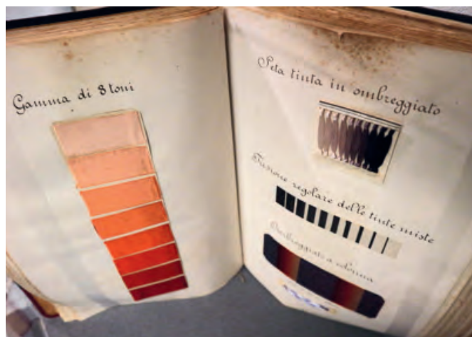
Quaderno di tessitura appartenente ad un ex studente di Setificio dei primi del '900

Nella sala della tessitura campeggiano due telai a mano: uno jacquard e uno a doppia ratiera con lettura del disegno ad assicelle, un orditoio per cimosse e un lisage dell'Ottocento. La tessitura meccanica è rappresentata da due telai meccanici OMITA, di produzione comasca, che risalgono agli anni Trenta e Quaranta.